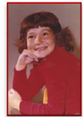
...immer aufmerksam und offen.