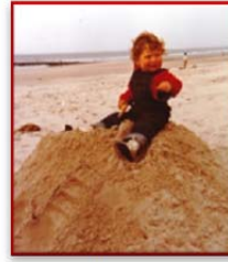
...keine Herausforderung zu hoch, ...