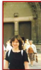
...sprachbegabt, (z.B. bei Sprachreisen in Frankreich)