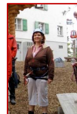
und in ungewöhnlichen Situationen.

Bereits seit 2001 habe ich neben der Tätigkeit als staatlich geprüfte Mototherapeutin erste Erfahrungen als Projektassistentin bei unterschiedlichen Events und in unterschiedlichen Verantwortlichkeiten gesammelt.