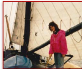
...und in ungewöhnlichen Situationen nie die Segel streichend,...