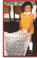
... früh in tragenden Rollen, ...