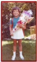
Lern- und wissbegierig von A-Z, ...