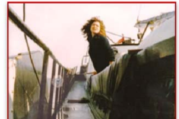
...sowie den Überblick behaltend.