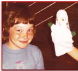
...neugierig bei Herausforderungen...