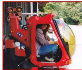
...und immer mobil.

Von 1999 bis 2003 Tätigkeit als staatlich geprüfte Mototherapeutin in der Kinder- und Jugendambulanz Lichterfelde.