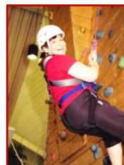
...auf dem Weg nach oben,...