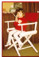
... und topfit in Kommunikation und Technik.