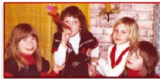
...im Mittelpunkt von Events...